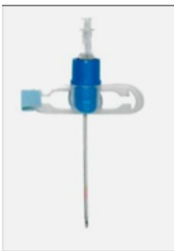
Figura 6. Jet ventilation catheter acc. to Ravussin (VBM Medizintechnik GmbH-Germany)

Hay muchos disponibles. Uno de ellos es el Ravussin, que viene en 3 tamaños: 13G, 14G, 16G para adultos, niños, y bebés respectivamente. Son resistentes a los acodamientos y se utilizan también para ventilación jet manual.