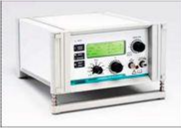
Figura 3. Mistral Jet Ventilator