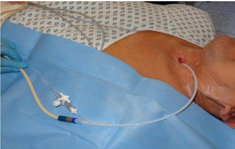
Figure 2.2 Transtracheal jet ventilation in practice