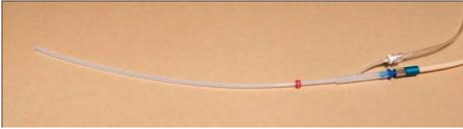
Figura 5. LaserJet Catheter (Acutronic Medical Systems)

El catéter de la fig. 5, viene en 2 medidas, 40 y 70 cm. Ambos tienen un diámetro externo de 3,4 mm. Tienen doble luz (a igual que el Hunsaker), una para el aporte de gas y la otra para monitoreo de presión y EtCO 2 .