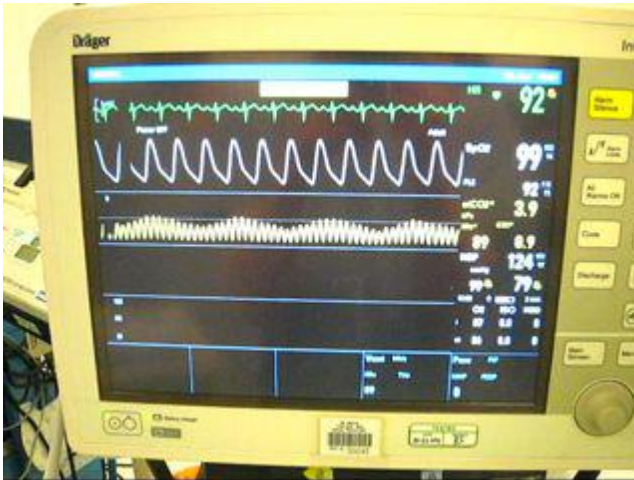
Figura 7. Capnograph during HFJV technique

Cuando termina la cirugía y el paciente muestra signos de esfuerzo ventilatorio, se discontinúa la HFJV. Se administra O 2 suplementario con máscara/bolsa y se retira el catéter de la misma manera que un tubo traqueal.