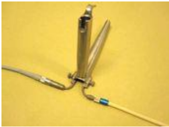
Figura 1. Rigid bronchoscope with jet ventilator attached for supraglottic jetting

Permite un campo quirúrgico libre de tubo traqueal. Igualmente esta técnica requiere el mantenimiento de la vía aérea por el cirujano, y la calidad de la ventilación puede alterarse por la mala alineación del jet con la vía aérea durante el acceso al sitio operatorio. Hay mayor movilidad de las cuerdas vocales comparado con las otras técnicas y mayor riesgo de restos sanguíneos en la vía aérea. No es posible monitorizar la PAWP o la EtCO 2 con este acceso.